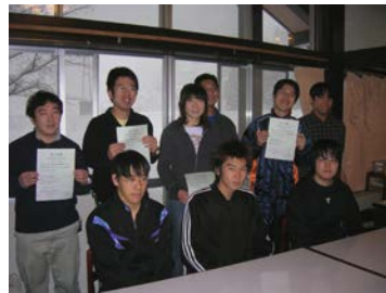
若者自立塾 第一期生 修了式の様子